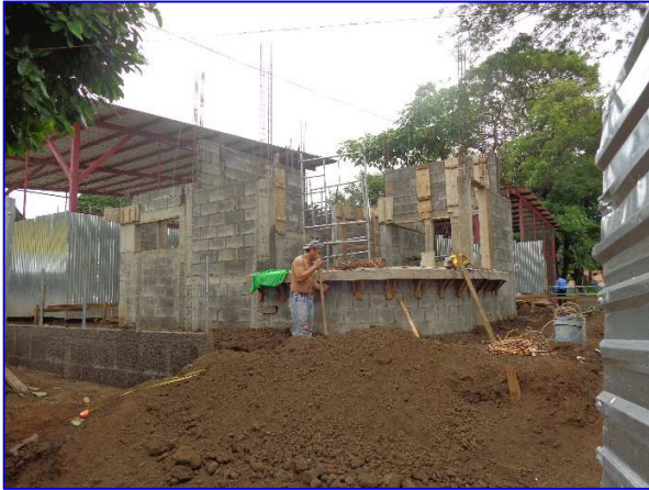
Panorámica del Puesto de Seguridad, observar la ejecución de las actividades de mampostería, estructura de concreto.

El proyecto consiste en la construcción del edificio destinado para el uso del personal de seguridad de la División de Instalaciones Deportivas y de ahí llevar a cabo las labores centrales de control, monitoreo, seguridad de las actividades tanto deportivas como administrativas de la institución. Tendrá un área de construcción aproximada de 45.00 m 2 y contará con los siguientes ambientes: Vestíbulo, Área de guarda de Turno, Área para el Monitoreo y Control de Cámaras, la Oficina del Jefe de Seguridad, Área de Lockers y Vestidores para todos los agentes de seguridad, un servicio sanitario con su ducha y un área de pantry.