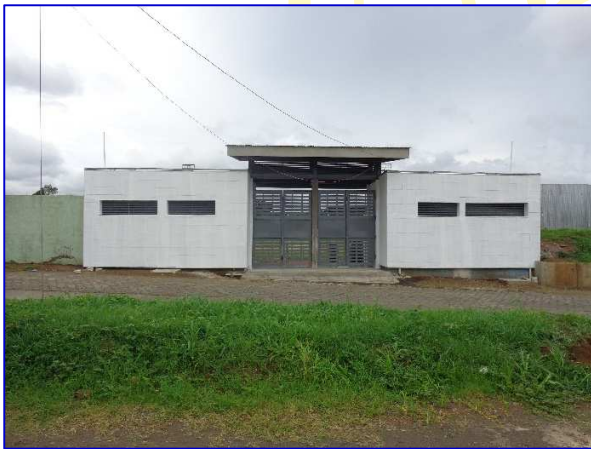
Portón de acceso noreste y servicios sanitarios para público N° 1.

El proyecto consiste en la construcción de pista de atletismo para calentamiento con superficie asfáltica, con una dimensión longitudinal de 132.00 m con 4 carriles, sala de certificación, fotofinish y sala técnica. A la vez se rehabilitará los servicios sanitarios para el público y camerinos en áreas techadas y no techadas del estadio; mejoramiento de accesos principales, mejoramiento de graderías y obras exteriores para brindar un mejor confort a los atletas y público en general.