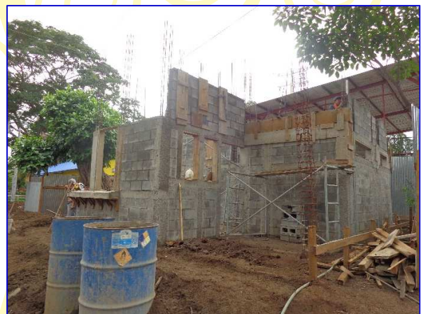
Costado Noroeste del puesto de seguridad, apreciar la ejecución de las actividades de estructura de concreto, mampostería.

En Junio se tuvo un avance del 25.30%, en la ejecución de las actividades de estructura de concreto, mampostería, construcción de muro de retención de piedra cantera.