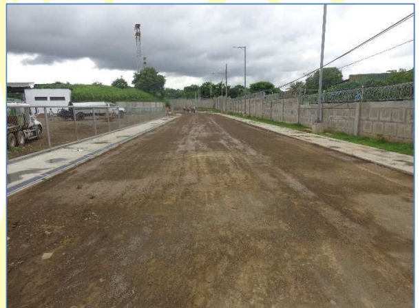
Panorámica de la pista de calentamiento donde se aprecia la aplicación de la primera mano de imprimación de asfalto, iluminación y andenes.

En el mes de junio 2017 se tiene un avance del 79.01%, en la ejecución de construcción de top de lavamanos, imprimación de asfalto y obras exteriores en la pista de atletismo; construcción de bancas móviles para jugadores de fútbol; continuación del enchape de azulejos en paredes.