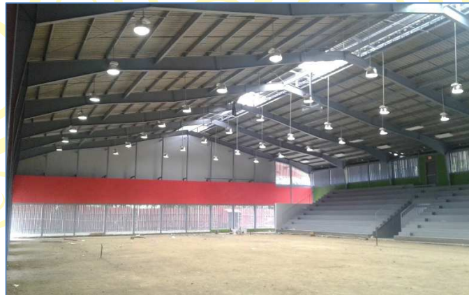
Vista interna de las instalaciones del Gimnasio de Combate donde se aprecia la instalación y prueba de luminarias.

El proyecto consiste en la ampliación y reemplazo de las Graderías existentes, en un área de 392 m 2 , mejorar las baterías de servicios sanitarios, nivelación de cancha (Losa de Piso), mejoramiento en fachadas existentes para dar mayor ventilación a los ambientes y la instalación en la cubierta de techo con aislante térmico en Área de 1440 m 2 .